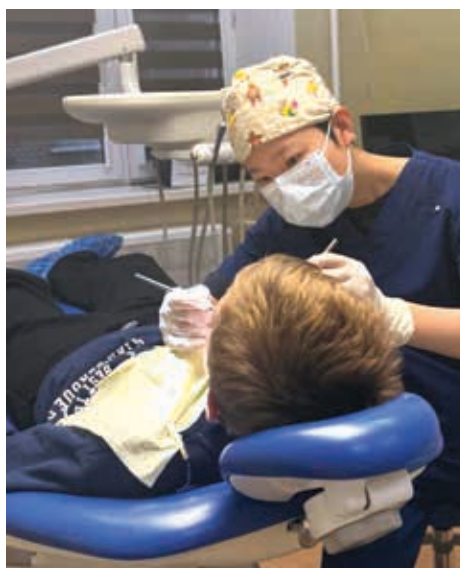
Рисунок 2. Проводится оценка индекса зубного налета у детей

Средняя частота кровотечений десен с 1-й по 2-ю неделю составила: группа А: 28,9–12,3%; Группа В: 30,1–21,7%; Группа С: 30,2–18,4% (разница между группами статистически значима, p = 0,003 ).