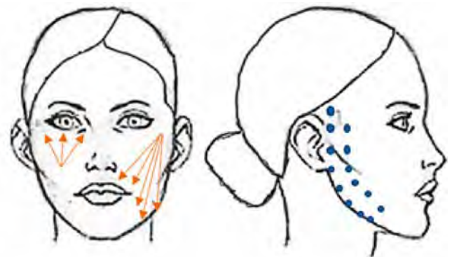
Рисунок 1. Процедура проходит с использованием канюли, с введением препарата NOVACUTAN YBio и SBio в точки, показанные на рисунке

Эффективность процедуры приведена на рис. 3.