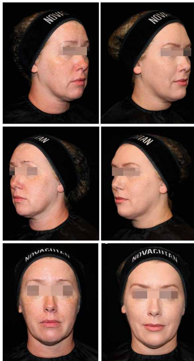
Рисунок 3. Эффективность применения экзопротекторов NOVACUTAN YBіo и SBіo при динамическом наблюдении до (А) и после проведения процедуры (Б)

Протоколы «Beauty Flash» и «High-light» могут успешно применяться для подготовки к важным событиям или